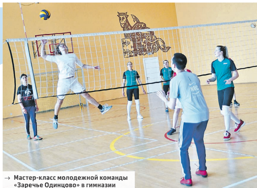
→ Мастер-класс молодежной команды «Заречье Одинцово» в гимназии

мают с явной определенностью, есть определенная надежда, что запланированный праздник волейбола для учащихся школ Одинцовского городского округа всё же состоится в той или иной форме. Во всяком случае, рабочая группа из специалистов гим-