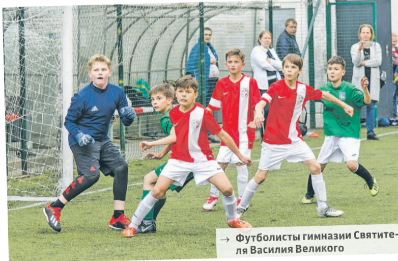
→ Футболисты гимназии Святителя Василия Великого

Дальше – больше. Как уже говорили, Гимназия Святителя Василия Великого и сама стала федеральной экспериментальной (инновационной) площадкой, т.е. полноправным участником процесса подготовки спортивного резерва. А весной этого года еще и победила в конкурсе Министерства спорта России на предоставление грантов из федерального бюджета в области физической культуры и спорта.